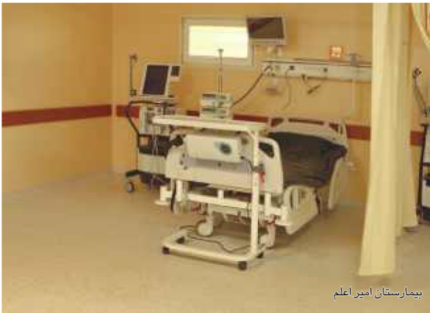
بیمارستان امیر اعلم